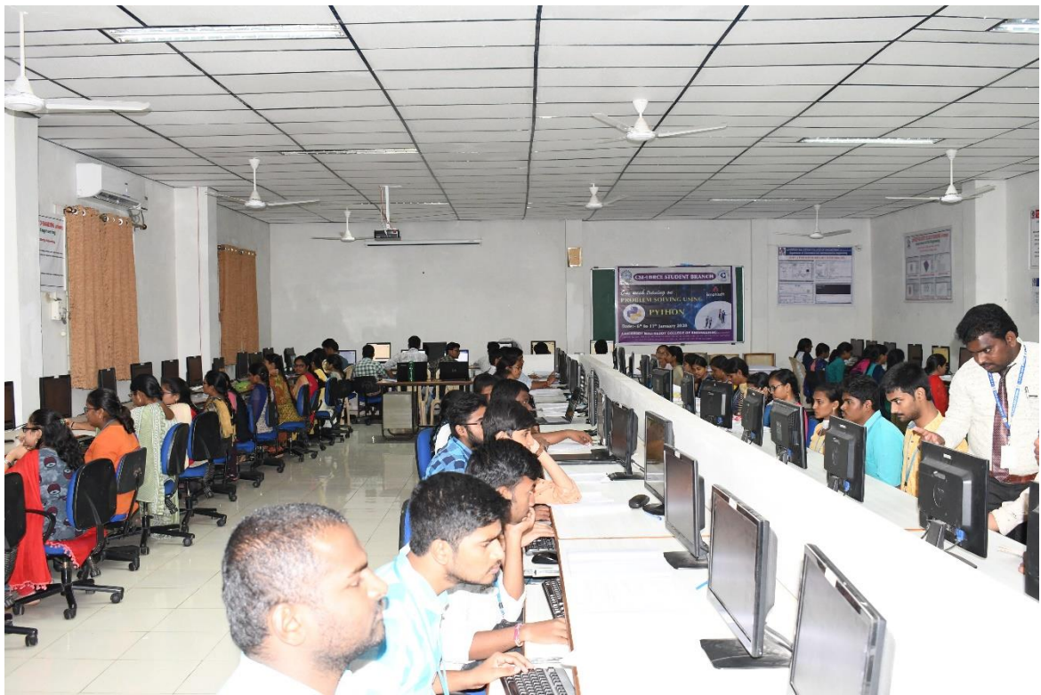
During the training